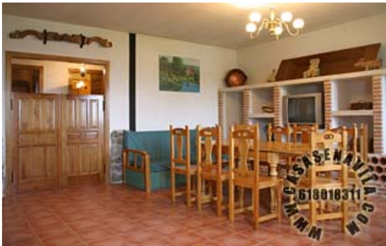
Comedor Vista 1

Otras Casas Rurales en Gredos de 2 a 20 Plazas pulsando aquí.