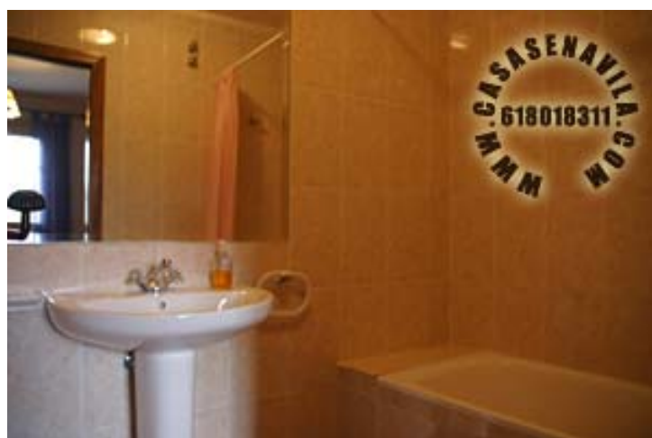
Baño Hab. 3