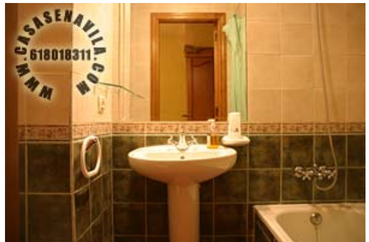
Baño Hab. 1