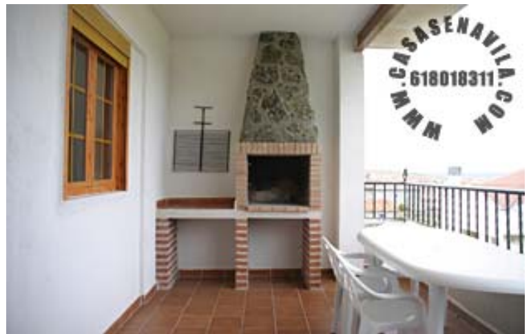
Terraza con Barbacoa de Piedra