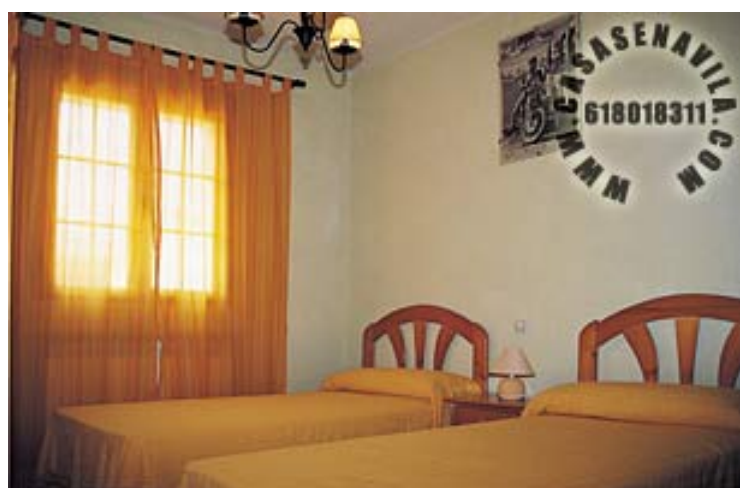
Habitación 5 (Opcional)