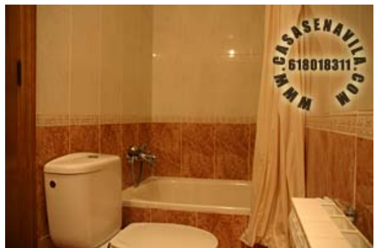
Baño Hab. 2