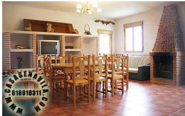
Comedor Vista 2