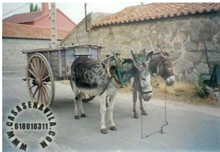
Carro de Burros