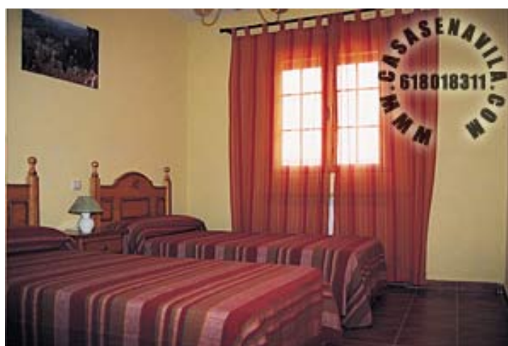
Habitación 4 (Opcional)