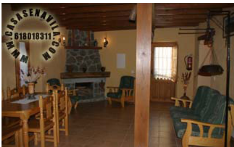
Comedor Vista 1

Otras Casas Rurales en Gredos de 2 a 20 Plazas pulsando aquí .