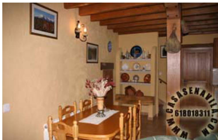
Comedor Vista 2