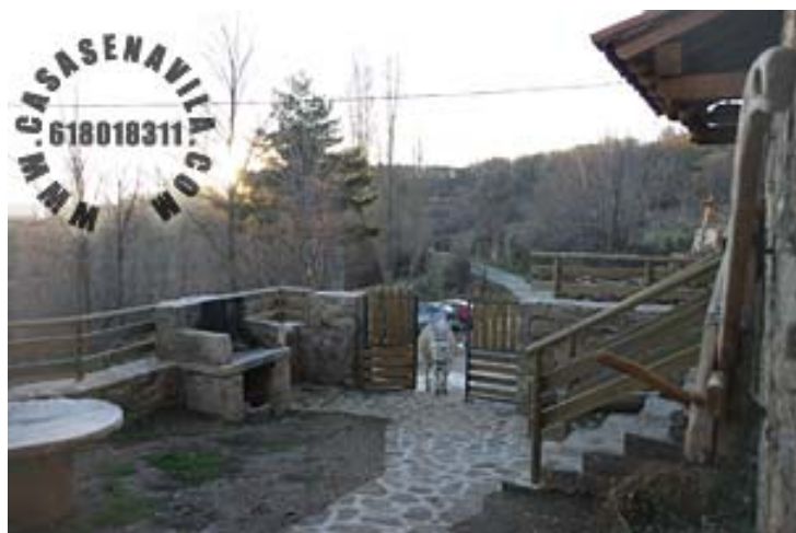
Patio con 2 Barbacoas