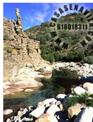
A Peña Vieja