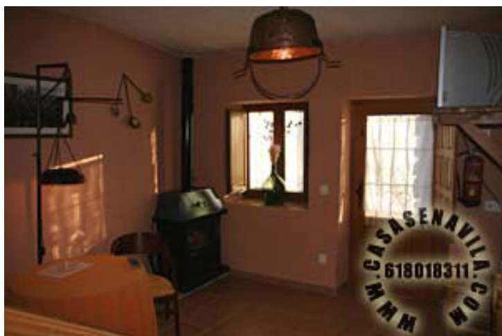
Comedor Vista 1

Otras Casas Rurales en Gredos de 2 a 20 Plazas pulsando aquí.