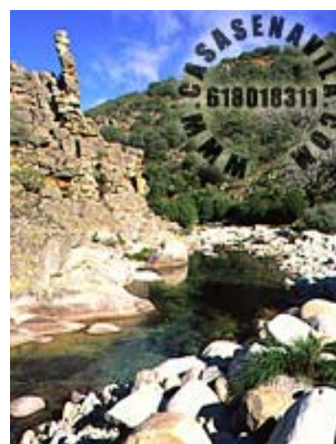
A Peña Vieja