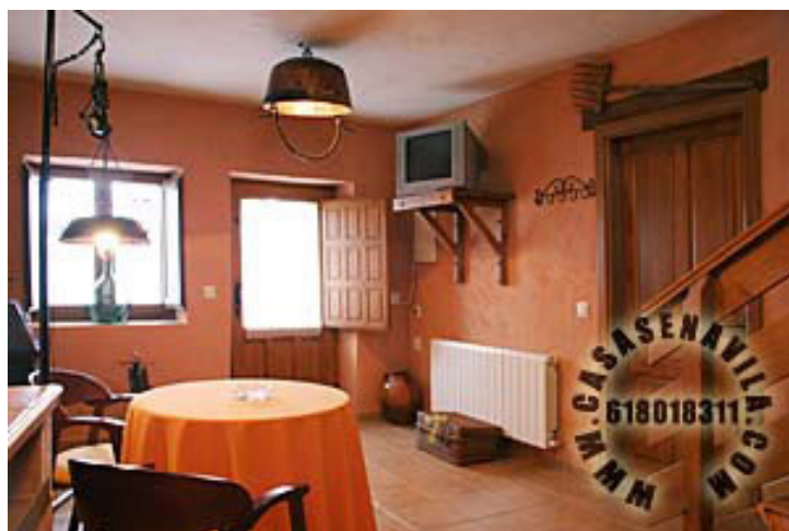
Comedor Vista 2