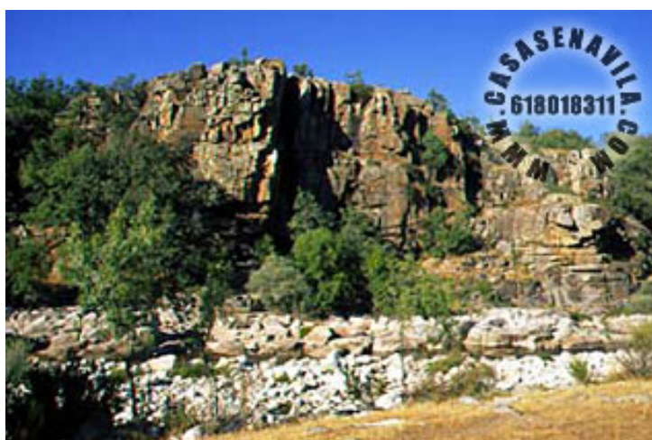
A Peña Vieja