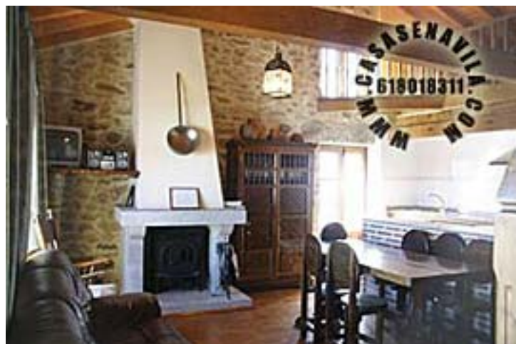
Comedor Vista 2