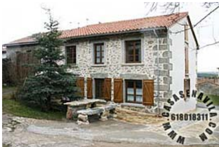
Fachada Esperilla I y II