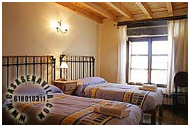
Habitación Doble 1