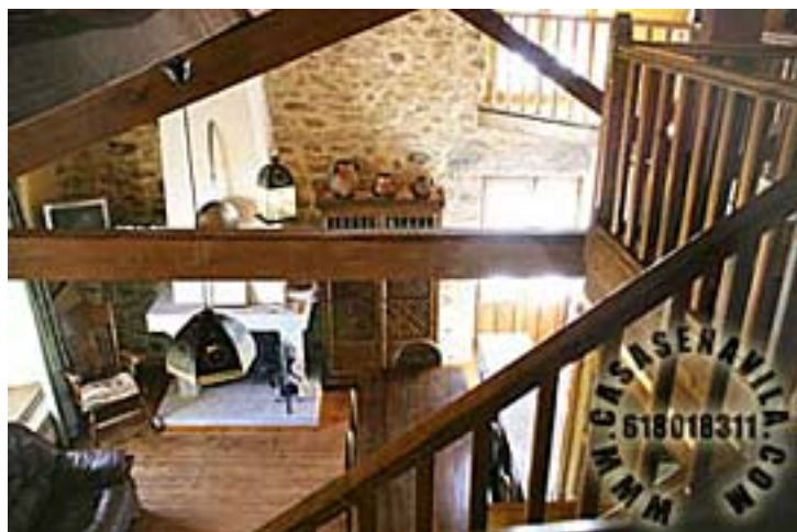
Comedor Vista 1

Otras Casas Rurales en Gredos de 2 a 20 Plazas pulsando aquí.