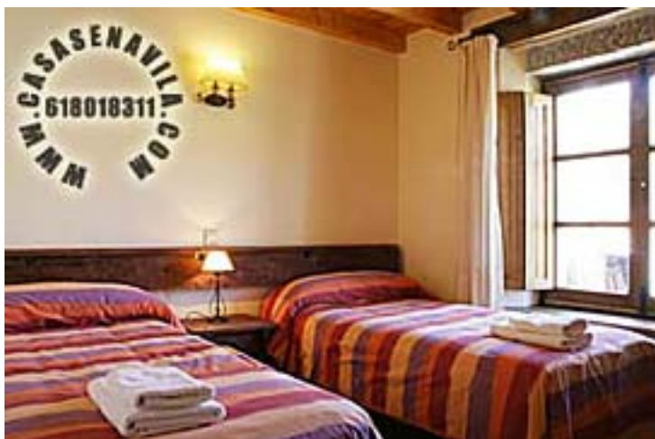
Habitación Doble 2

Otras Casas Rurales en Gredos de 2 a 20 Plazas pulsando aquí.