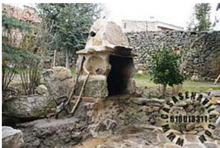
Barbacoa Esperilla I y II