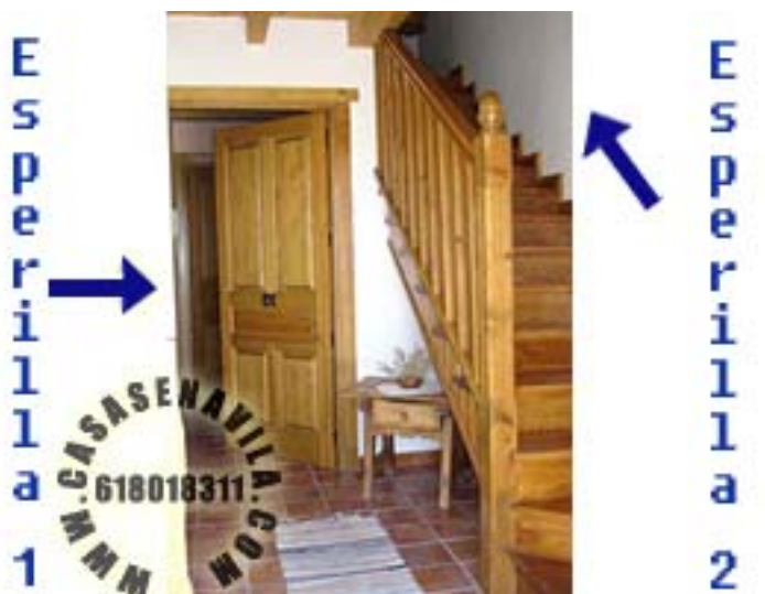
Hall de las Casas