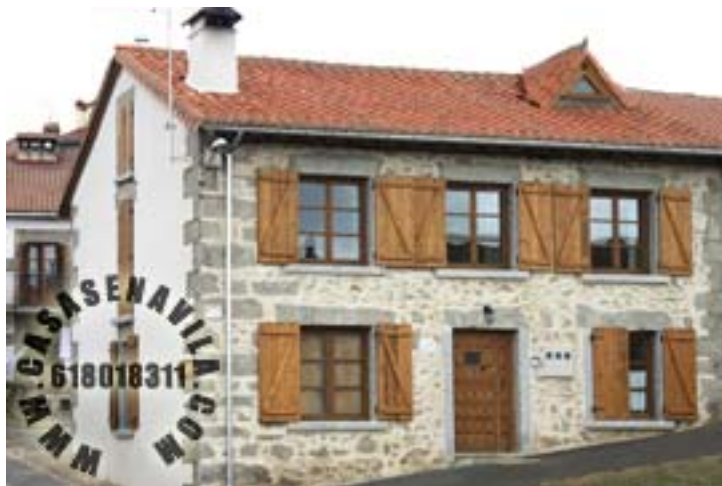
Fachada 2 Esperilla I y II