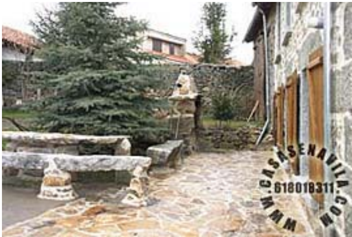
Patio Esperilla I y II

Otras Casas Rurales en Gredos de 2 a 20 Plazas pulsando aquí.