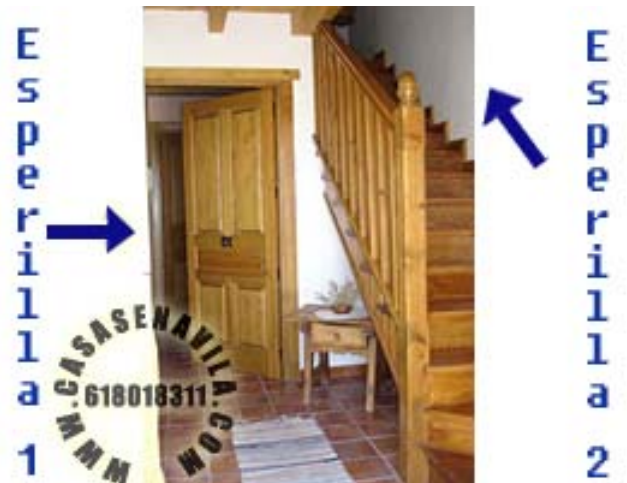
Hall de las Casas