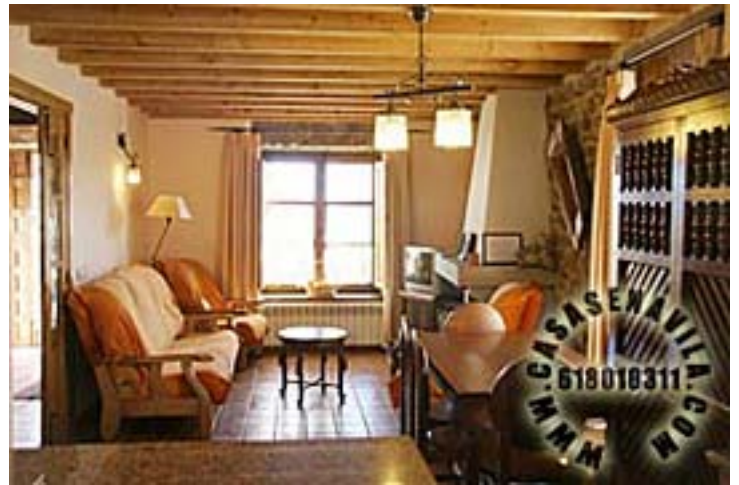
Comedor Vista 2