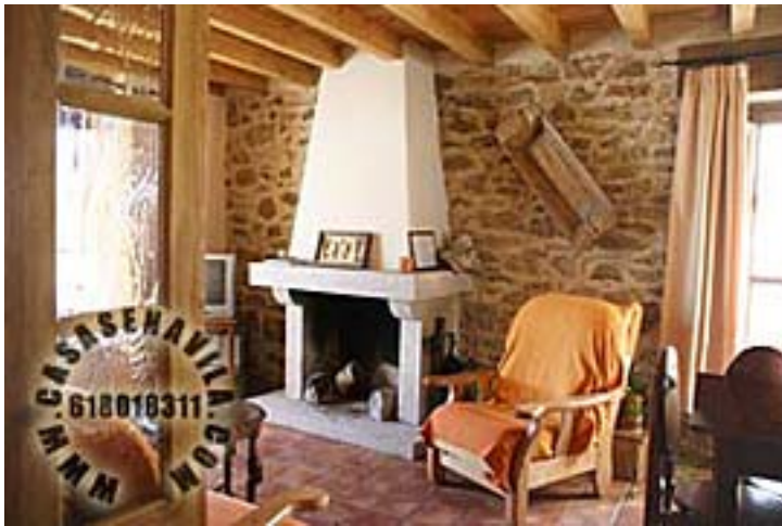
Comedor Vista 1

Otras Casas Rurales en Gredos de 2 a 20 Plazas pulsando aquí.