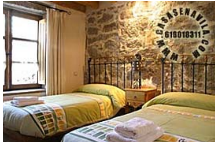
Habitación Doble 1