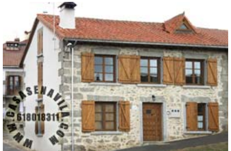
Fachada 2 Esperilla I y II