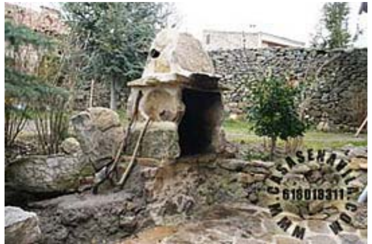
Barbacoa Esperilla I y II