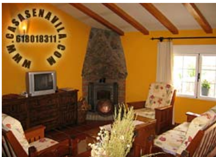
Comedor Vista 1

Otras Casas Rurales en Gredos de 2 a 20 Plazas pulsando aquí.