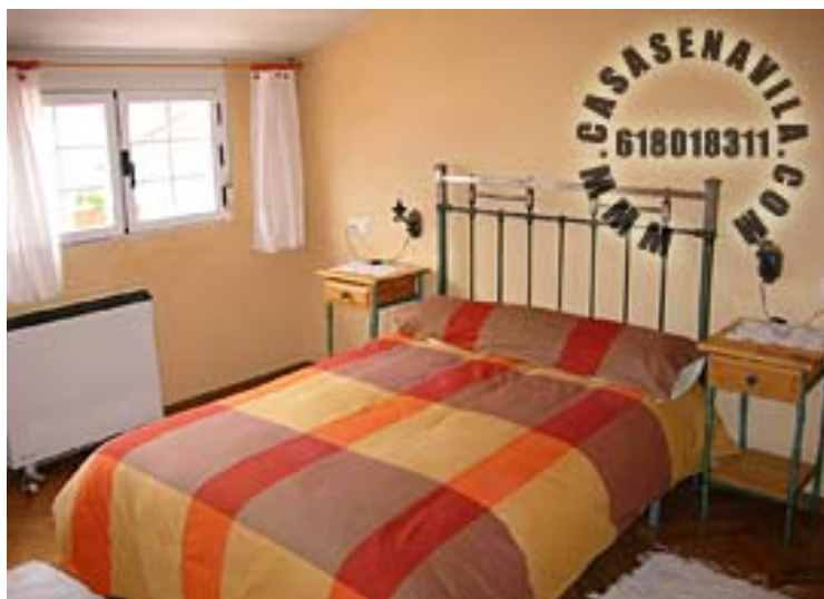
Habitación de Matrimonio