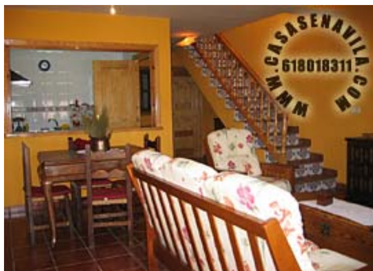
Comedor Vista 2