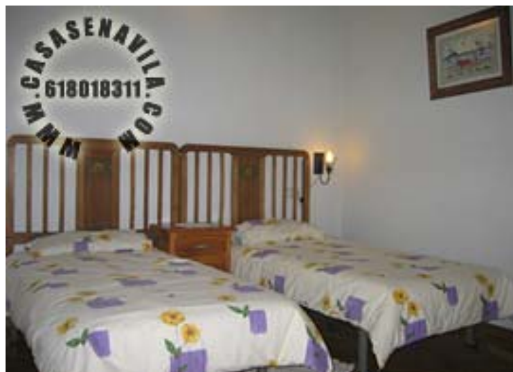
Habitación Doble 1