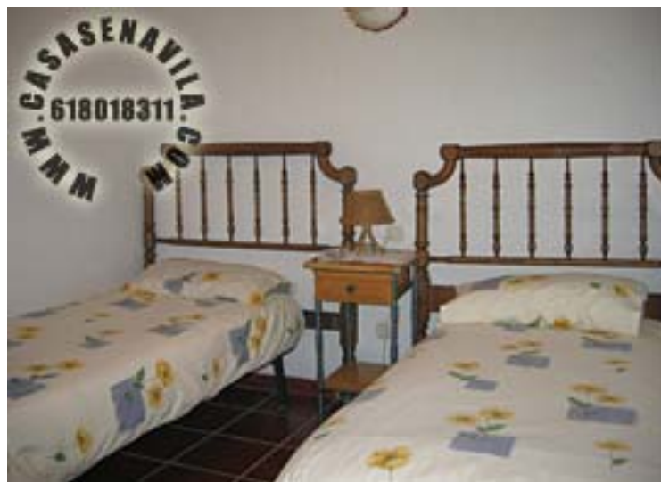
3ª Habitación (Opcional)