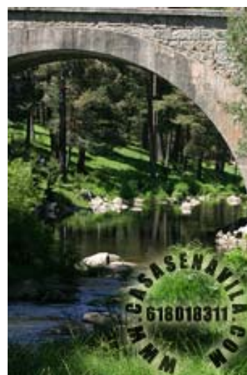
Puente del Duque