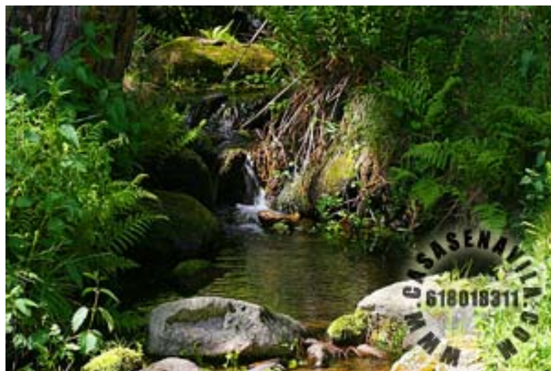
Charco 7 Fuentes