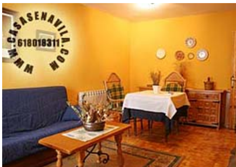
Comedor Vista 1

Otras Casas Rurales en Gredos de 2 a 20 Plazas pulsando aquí.