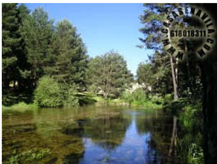
Puente del Duque

Otras Casas Rurales en Gredos de 2 a 20 Plazas pulsando aquí.