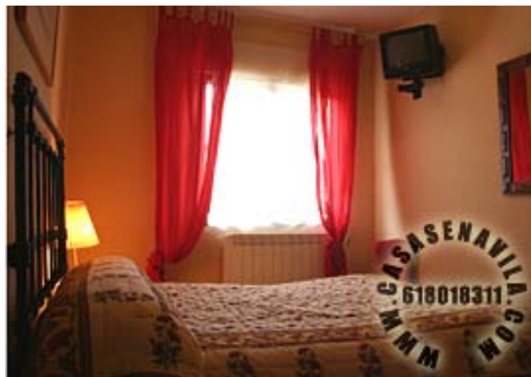
Habitación Vista 2