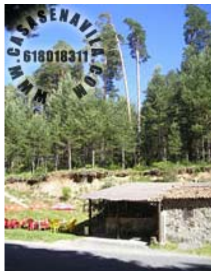
Zona de Barbacoas