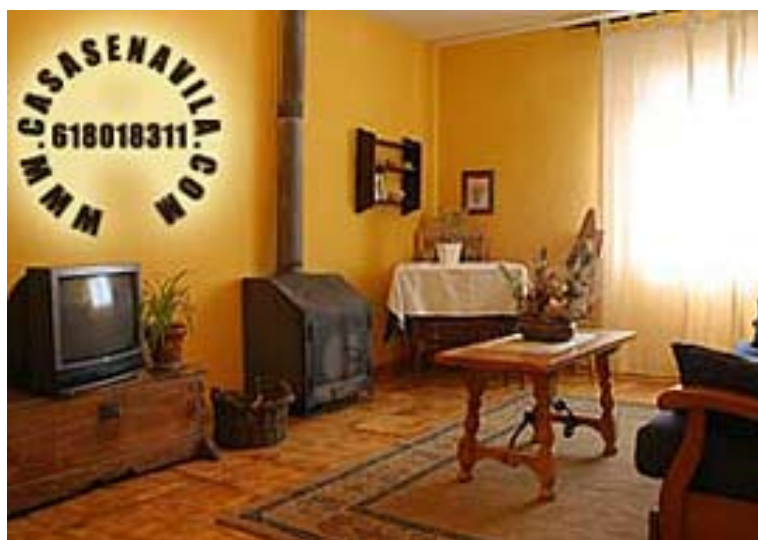
Comedor Vista 2