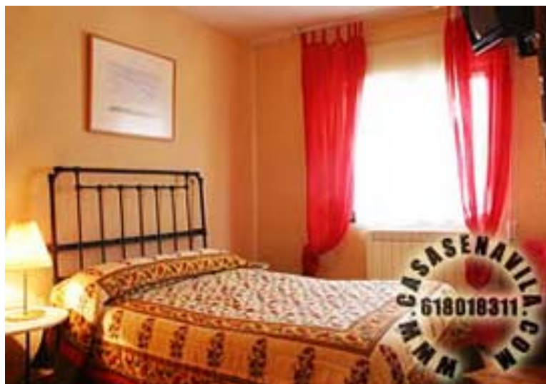
Habitación de Matrimonio